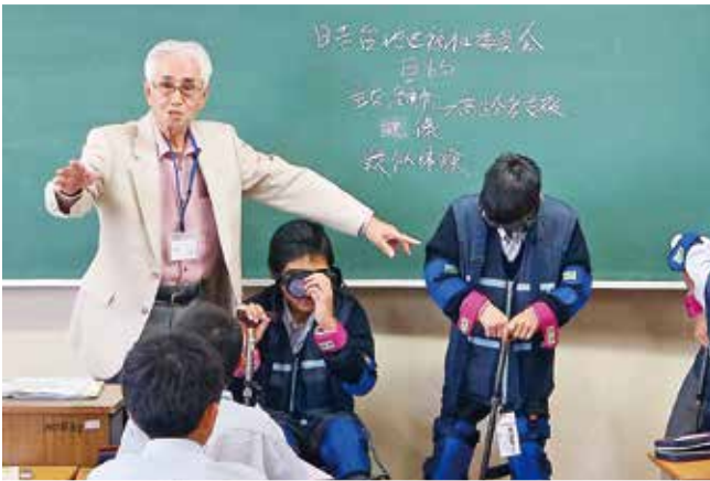
地域のおっちゃん・おばちゃんの等身大の活動を伝える