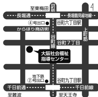
Osaka Metro(旧大阪市営地下鉄)谷町線・長堀鶴見緑地線 「谷町六丁目」駅下車④番出口から南西へ 400m