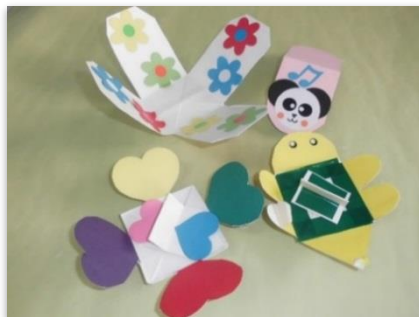
子どもの発達に応じた手づくりおもちゃの紹介