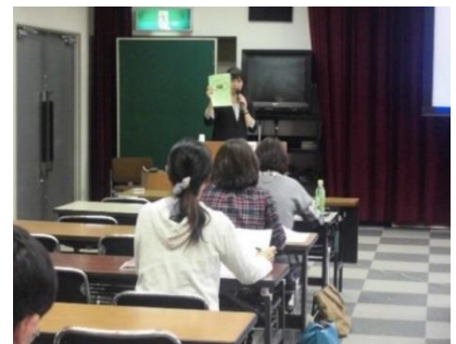
大阪府の最新の保育事情が聞けます