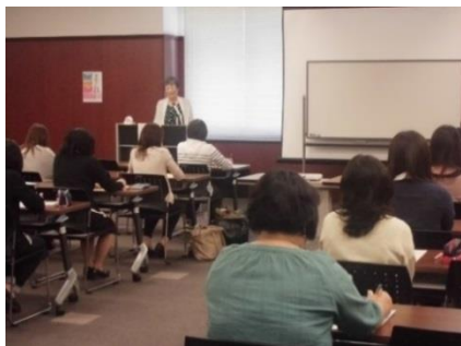
保育に活かせる知識を学べます