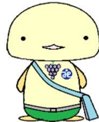
「ほのぼのちゃん」 柏原市社協イメージキャラクター