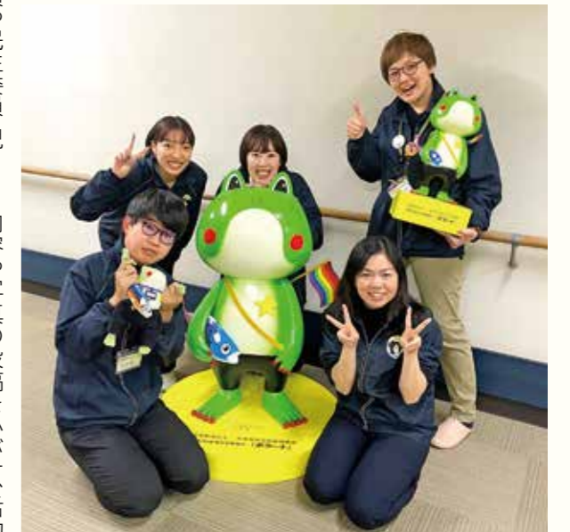
社協職員の皆さんとボラーナ(社協マスコットキャラクター)

秋の収穫祭イベントには行政職員が講師として参加。福祉委員や民生委員・児童委員は掲示板へのチラシ掲載やイベントの呼びかけなどに協力しています。地域住民や関係団体はRiBBOONを支える大きな力になっており、連携を図りながら活動を進めています。