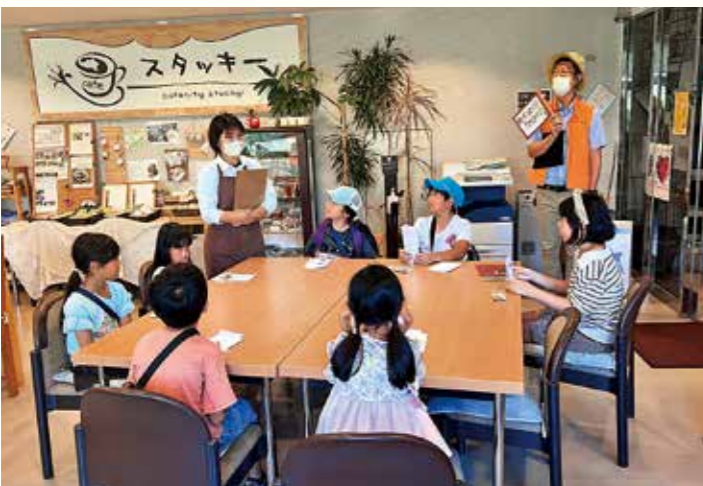
施設探検ツアーのようす

秋号から、府内4市の事例を通して「包括的支援体制」の具体的な取り組みを紹介しました。「大阪モデル」による地域共生社会の実現と、それを通じた地域福祉の一層の推進をめざします。