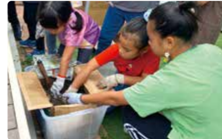
行政職員による「段ボールコンポストづくり」講座に、子どもたちは興味津々♪