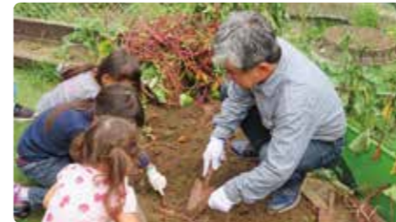
ボランティアがイベントに参加した子どもたちと、芋ほりをするようす